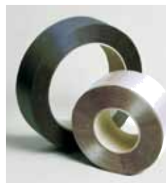
Bander af Polypropylen PP