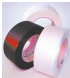
Smalle bånd af polypropylen PP

Kvalitet Kvalitetsbånd, leveres omhyggeligt opviklet, godt afbundet og emballeret i æsker