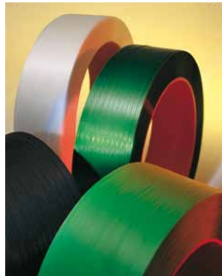
Polypropylen (PP) + Polyester (PET)