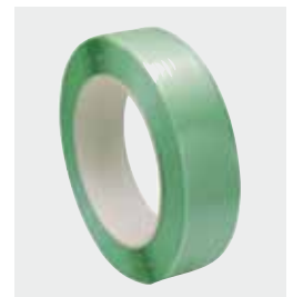
Meget stærke bånd af polyester PET