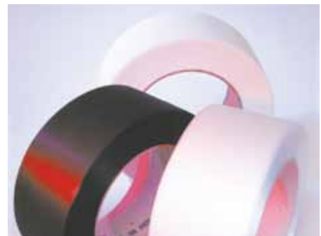
Trykte og bestemte bånder